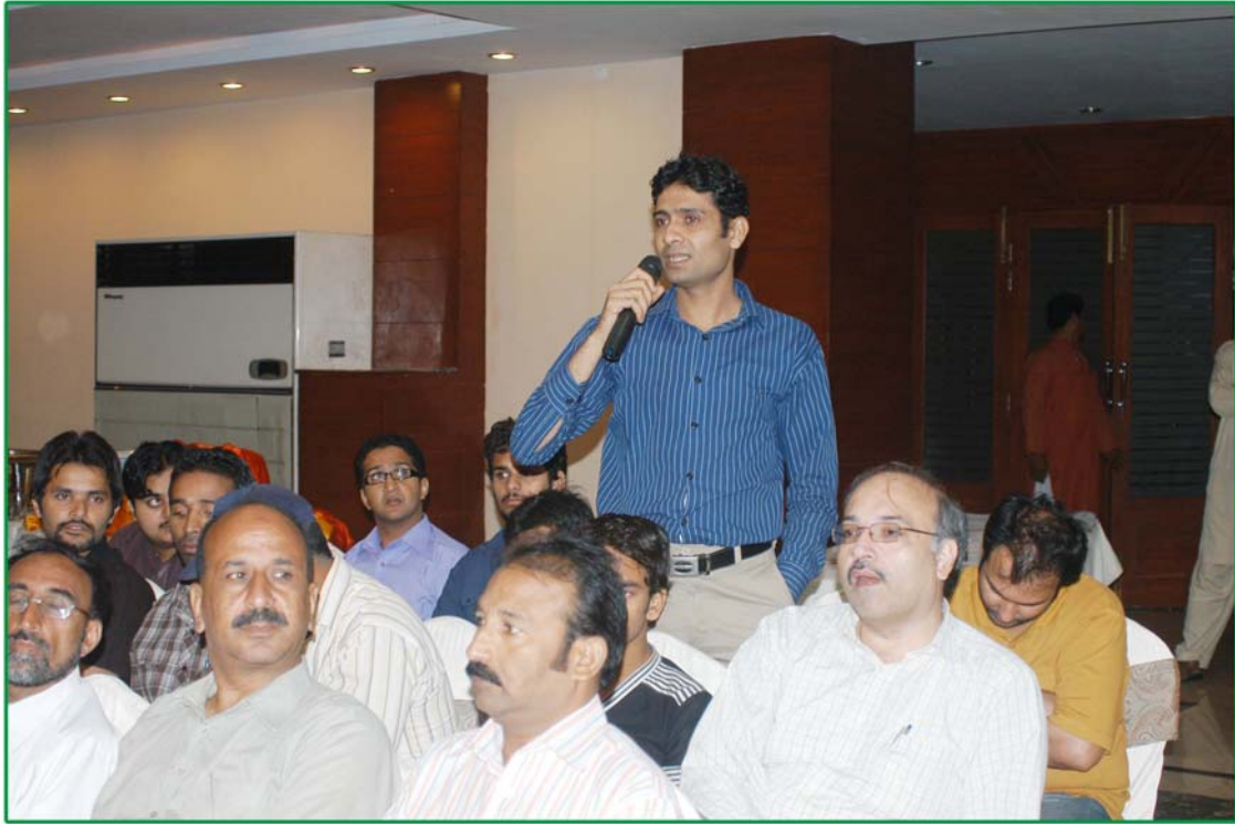
A Youth organization representative questioning during the Peace Seminar Question Answer Session organized by PCSW&HR on the eve of International Peace Day