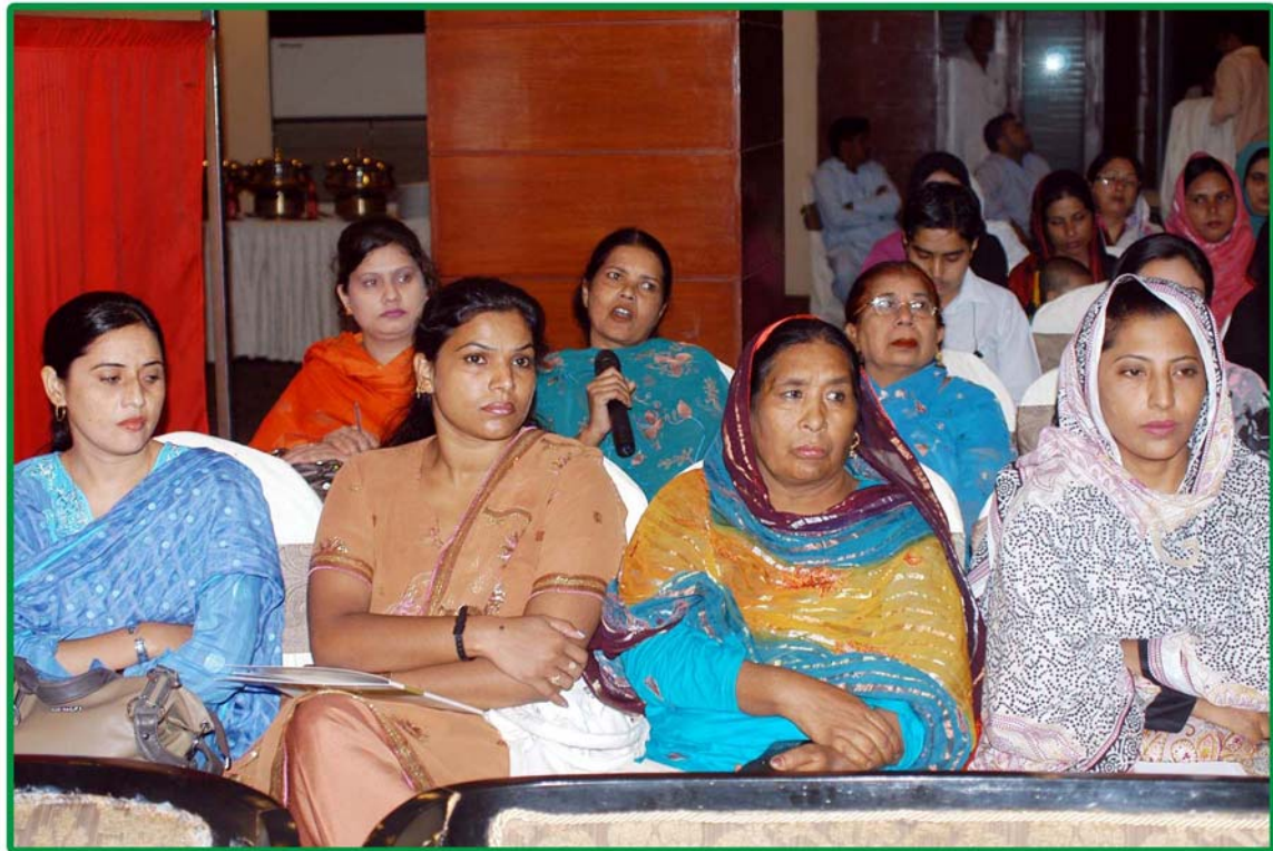
A female participant questioning during the Peace Seminar Question Answer Session organized by PCSW&HR on the eve of International Peace Day

Mr. Tahir Mehmood Hundli also said that Justice and fair play are pre requisite for a healthy and peaceful society. Disruption of peace is the reaction of terror, injustice and atrocity. In view of that Islam has placed great emphasis on adhering to justice and fair play irrespective of distinction of creed and community. Islam has prohibited partiality in the matter of justice, even if it concerns your blood relation. According to Islamic ideology all human beings stand equal for respect and kind consideration. Therefore, a human being who is respectable should not be subjected to atrocity and unfair treatment because that is disrespect and dishonor to him. The Holy Prophet (PBUH) declared that the protest of the victim of atrocity, irrespective of his creed and religion has the prospect of being heard by Allah. Discrimination among human beings is against humanitarian considerations. He further said that we should struggle collectively for the durable peace, elimination of terrorism, human development and protection of human rights at grass roots level with out any discrimination. He encouraged all the people who work for peace and unity. He said that even a small act of Love, Peace and Unity is very effective and beneficial to bring peace on earth. May peace prevail in earth. May peace prevail on earth.